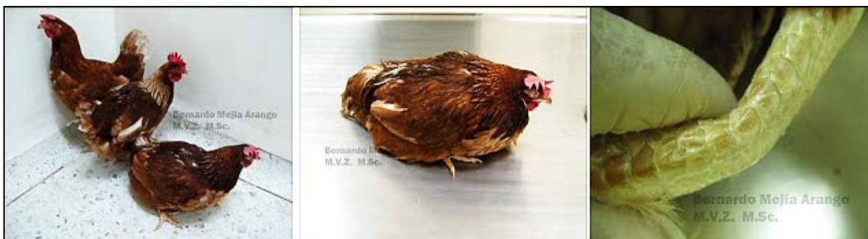
Imagen N° 9 Aves de 35 semanas de un lote de 45.000 aves en piso, de las cuales enfermaron 5.000. El protocolo de remisión de muestras reportó que las aves enfermas tenían conjuntivitis, pero no reportó problemas locomotores ni

Revisando los dos primeros términos, osteomalacia no es sinónimo de osteoporosis. En cambio, osteopenia se puede asimilar como sinónimo de osteomalacia. Hemos visto muchos casos de deficiente mineralización ósea en gallinas ponedoras explotadas en piso, en las cuales el hueso del tarsometatarso se dobla fácilmente antes de romperse, ante la presión con nuestros dedos pulgares contra una superficie dura o simplemente tratando de romper el hueso largo con ambas manos. Muy probablemente la matriz ósea está deficientemente mineralizada, es decir que puede haber reducción de la densidad del hueso.