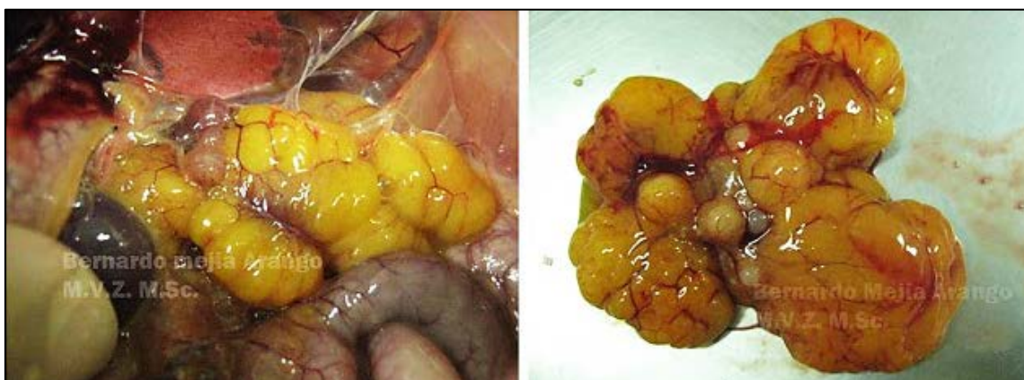
Imagen N° 10 Huevos morulados. Los ovarios que se presentan en ambas fotografías, corresponden a aves que se muestran en la imagen N° 2, en las cuales se diagnosticó parálisis de las jaulas, incluyendo una evaluación histopatológica (Imagen N° 8). Algunos Médicos Veterinarios con experiencia de campo en patología aviar, aseguran que el aspecto de estos óvulos se debe a una deficiencia de calcio.

Con frecuencia se observa en el proceso de necropsia, deformación de los óvulos, los cuales se aprecian con aspecto rugoso como si fueran saculaciones, en ausencia de un estado inflamatorio en el ovario y aún en la cavidad toracoabdominal en general. Algunos Médicos Veterinarios con experiencia de campo en patología aviar, aseguran que el aspecto de estos óvulos se debe a una deficiencia de calcio.