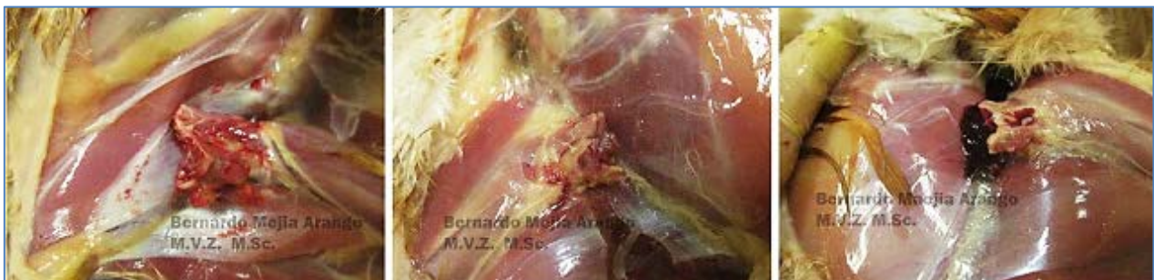
Imagen N° 4. Parálisis de las jaulas. Las tres fotografías fueron tomadas de las aves que se presentaron en la imagen N° 2. A pesar de la incapacidad para levantarse, las aves no tenían fracturas, Se examinaron macroscópicamente y microscópicamente el sistema nervioso central y el periférico para descartar otras enfermedades con un cuadro clínico similar. Durante el proceso de necropsia, al efectuar la luxación de la articulación coxofemoral, los fémures se rompieron, quedando las cabezas dentro de los acetábulos.

El diagnóstico de “parálisis de las jaulas” es impactante cuando en el proceso se observan fracturas. A veces no se producen las fracturas antemortem y llegamos al diagnóstico por la fractura de la cabeza del fémur (En la porción que la une con el resto del hueso) en el momento de realizar la luxación de las extremidades pélvicas en el proceso de necropsia. Con frecuencia las aves son enviadas para diagnóstico, cuando no es evidente aun el proceso patológico y las aves presentan una sintomatología diferente por ejemplo de tipo respiratorio. Es decir, puede llegar a ser un hallazgo de necropsia.