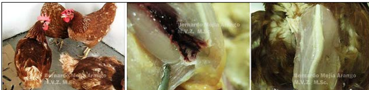
Imagen N° 6 Las fotografías que componen la imagen, corresponden a ponedoras de 73 semanas de edad, de una batería de jaulas de 20.000 aves de las cuales se reportaron 10.000 enfermas; en el protocolo de envío de muestras se describen los siguientes síntomas: animales postrados, pérdida de peso, conjuntivitis. El protocolo o historia reporta una mortalidad del 0.48%.

A la necropsia, suelen observarse las costillas torcidas y la quilla delgada y con desviaciones, ocasionalmente se fracturan durante la manipulación.