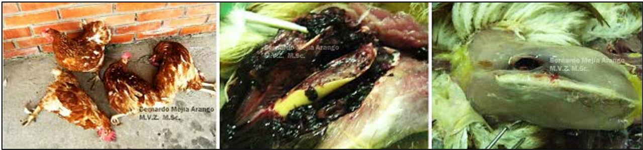
Imagen N° 3. Parálisis de las jaulas. Aves de 73 semanas de edad. Izquierda: se observan las aves, las cuales fueron remitidas para examen por presentar inflamación ocular. Durante la manipulación y el transporte sufrieron fracturas del fémur (Fotografía del centro) y del hueso de la quilla entre otras (Fotografía de la derecha). La fragilidad ósea no se hizo evidente hasta cuando las aves fueron manipuladas. La batería de donde proceden estas aves estaba compuesta por 50.000 animales y en el protocolo de remisión al laboratorio solo indican inflamación ocular, con la misma cantidad de animales afectados. Las aves padecían de desmineralización ósea, pero esta no se hizo evidente en la granja; esto sucede con alguna frecuencia: se detecta el problema en el momento de la necropsia.

El diagnóstico de “parálisis de las jaulas” es impactante cuando en el proceso se observan fracturas. A veces no se producen las fracturas antemortem y llegamos al diagnóstico por la fractura de la cabeza del fémur (En la porción que la une con el resto del hueso) en el momento de realizar la luxación de las extremidades pélvicas en el proceso de necropsia. Con frecuencia las aves son enviadas para diagnóstico, cuando no es evidente aun el proceso patológico y las aves presentan una sintomatología diferente por ejemplo de tipo respiratorio. Es decir, puede llegar a ser un hallazgo de necropsia.