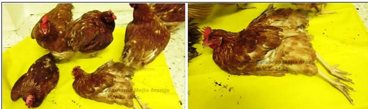
Imagen N° 2. Parálisis de las jaulas. Las aves provienen de una batería de 9.629 aves de 34 semanas de edad, de las cuales enfermaron 200 con postración e incapacidad para moverse. Se reportan 20 aves muertas. Si no hay una evidencia macroscópica suficiente para establecer el diagnóstico de parálisis de las jaulas, es necesario incluir otras enfermedades en los diagnósticos probables y realizar las investigaciones respectivas. Aves postradas como estas, se presentaron en el artículo sobre neuropatía periférica en este mismo blog.

Fatiga en la acepción de la palabra se refiere prácticamente a cansancio; es un término mal aplicado para el tema que nos interesa en este artículo. El nombre fatiga de jaula se le da a las aves afectadas porque se echan sobre los tarsos, dando la impresión de estar fatigadas, o cuando por causa de la fractura de uno de los huesos largos de las extremidades pélvicas, se niegan a moverse y permanecen postradas.