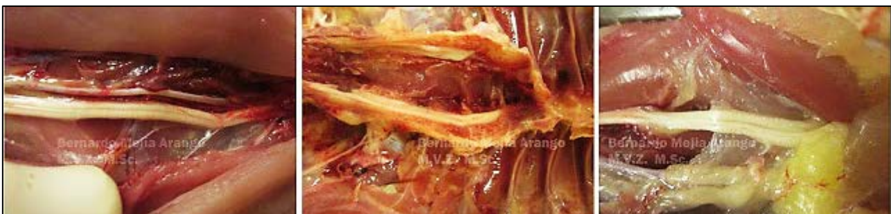
Imagen N° 5: las tres fotografías que componen la imagen, fueron tomadas de las aves que se presentan en la imagen No. 2. Se evaluaron macro y microscópicamente los nervios ciáticos, en los cuales no se observaron lesiones. La fotografía central muestra la apertura de los cuerpos vertebrales para evaluar el estado de la medula espinal. No se observaron lesiones

Se detecta el problema en las granjas, porque generalmente aparecen paralizadas, quietas. Encontrar las aves postradas, quietas o simplemente paralizadas, no tiene carácter diagnóstico en relación con la parálisis de las jaulas, pues existen varios estados patológicos que pueden conducir a que las aves presenten una sintomatología similar: la neuropatía periférica es una de ellas, la enfermedad de Marek es otra; se podría incluir igualmente una deficiencia de riboflavina.