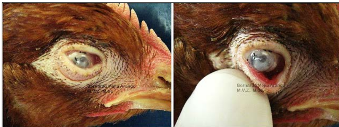
Imagen N° 10. Queratitis y micosis oculares. Polla de levante de 11 semanas de edad; en la granja hay 17.140 aves y se encuentran afectadas 3.000 según el informe de remisión de aves para exámenes de laboratorio; durante el episodio han muerto 122 aves. La historia dice que las aves comenzaron a enfermarse después de una vacuna triple contra Avibacterium paragallinarum y contra Pasteurella , la cual se aplicó vía intramuscular. En todas las aves remitidas para exámenes se observó miopatía pectoral profunda postvacunal.

Prevenir la presencia de micosis en los las lotes de aves depende tanto de la calidad de las aves recién nacidas, las cuales pueden llegar infectadas desde la incubadora, o provenir del medio ambiente de la casta o galpón; los recuentos de unidades formadoras de colonia de hongos en cama, pueden ser altos y pueden ser la fuente de infección para las aves.