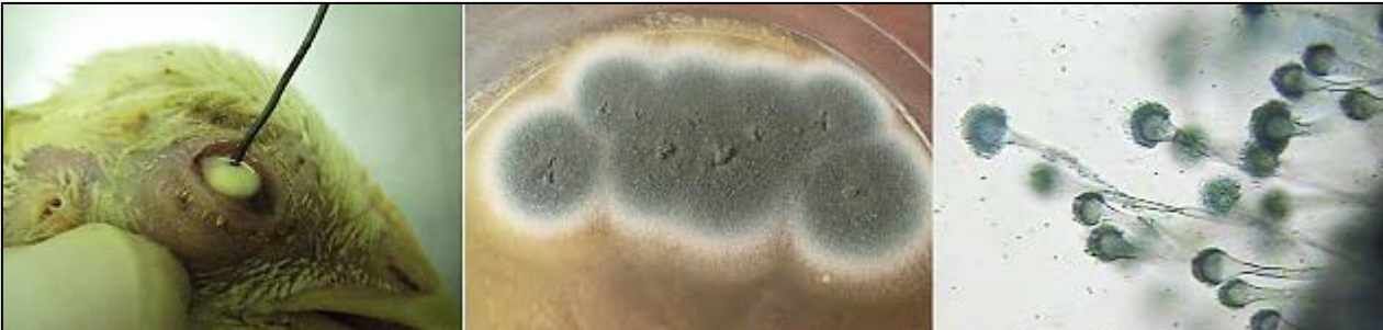
Imagen N° 5. Queratitis y micosis oculares. La fotografía de la izquierda corresponde a un pollo de engorde de 13 días de edad que proviene de un lote de 94.656 aves. Los datos consignados en la historia no indican cuantas aves enfermaron (Se reportó solo la mortalidad); dice que en las aves que murieron se encontraron lesiones inflamatorias con granulomas indicativos de micosis en sacos aéreos; 2.624 animales murieron durante el episodio. En el estudio histopatológico se encontraron las bolsas de Fabricio normales. A partir del material purulento de la cámara anterior del ojo se hicieron cultivos en agar Sabouraud, asilándose Aspergillus flavus en 48 horas de incubación de los medios de cultivo inoculados. La fotografía de la derecha corresponde a un extendido de las colonias de hongos que se muestran en la fotografía del centro: se observan conidióforos con vesícula globulosa, con cadenas radiadas de conidios (Azul de lactofenol, 100X). Muy probablemente hubo diseminación hemática de la infección micótica, desde las vías respiratorias.

Encontrar casos de micosis en vías respiratorias en aves de 4 días de edad o menos, es fácilmente atribuible a la adquisición de la infección en incubadoras contaminadas; pero en raras ocasiones las micosis oculares son atribuibles a este factor porque difícilmente se encuentran a esa edad.