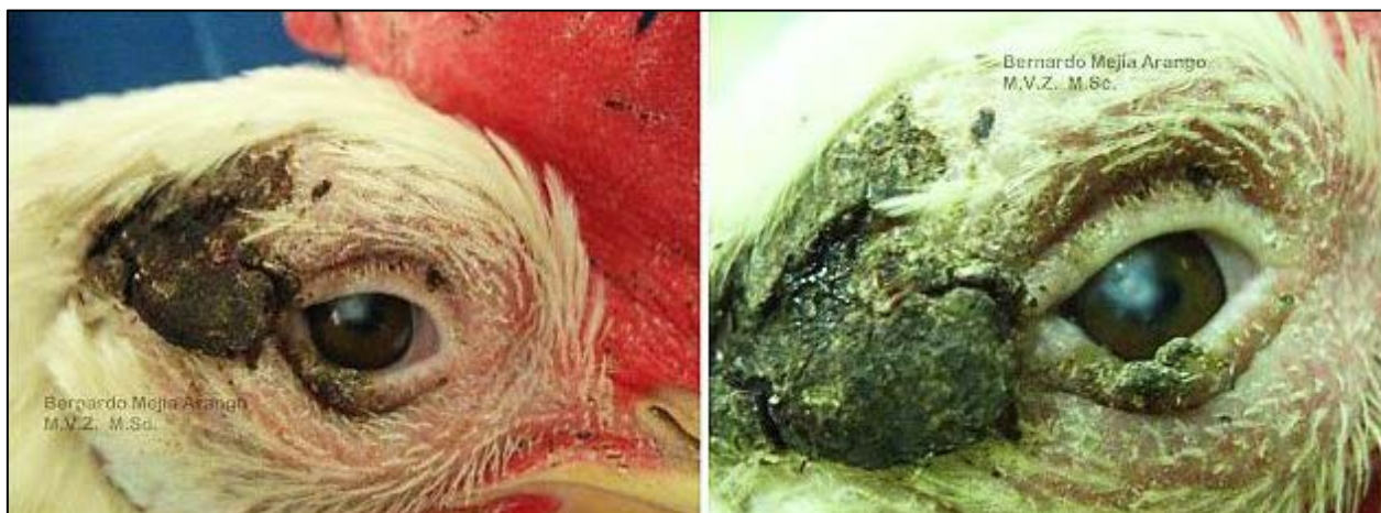
Imagen N° 3. Queratitis y micosis oculares. Las fotografías muestran lesiones en la córnea de una gallina de 23 semanas de edad. El protocolo de remisión de las aves para exámenes de laboratorio, indica que en la granja hay 70.000 animales y que 13.000 de ellas presentan lesiones nodulares, generalmente unilaterales, de color pardo oscuro o ligeramente negras. La evaluación histopatológica mostró lesiones palpebrales de viruela aviar. La queratitis que se observa, muy probablemente es consecuencia del trauma por causa de las lesiones nodulares palpebrales.

Los estados de infección ocular con hongos, generalmente del género Aspergillus , están relacionados con factores propios del ave y que generalmente comprometen su estado inmunológico al igual que factores inherentes al medio ambiente y al manejo con compromiso de la higiene de las casetas o galpones.