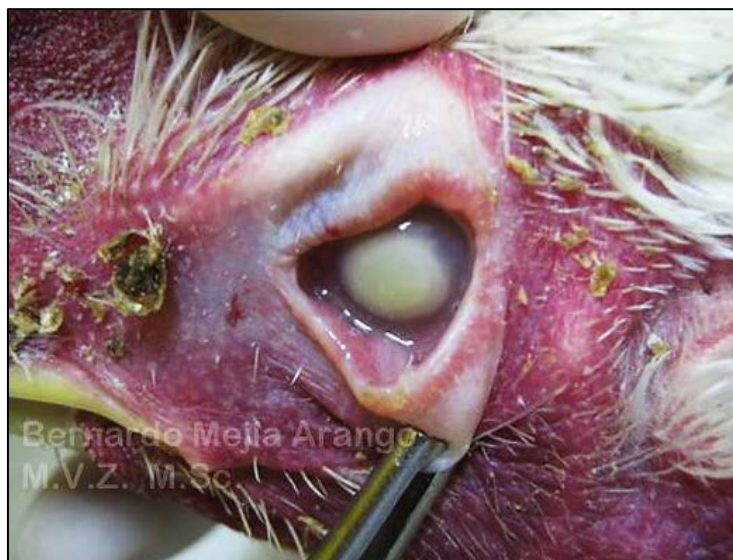
Imagen N° 1. Queratitis y micosis oculares. Gallina de 27 semanas de edad procedente de un lote de 33.400 animales de los cuales fueron remitidos cinco para exámenes de laboratorio porque ocasionalmente se encontraban aves con síntomas respiratorios y lesiones oculares. La córnea conserva su aspecto liso y brillante. Muy probablemente la infección que se observa en la cámara anterior del ojo, llegó allí vía hemática.