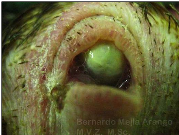
Imagen N° 2. Queratitis y micosis oculares. La fotografía fue tomada a una gallina de 73 semanas de edad, procedente de una granja con 50.000 aves. La historia remitida, indica que todas las aves están afectadas y que tienen inflamación ocular. La mayoría de las aves afectadas tenían lesiones nodulares de color pardo oscuro, con formación de escara. El diagnóstico histopatológico fue viruela aviar. En la fotografía se pretende mostrar las lesiones inflamatorias de la córnea, la cual ha perdido sus aspecto liso y brillante; aunque probablemente hay material purulento/caseoso en la cámara anterior del ojo, la infección es consecuencia de las lesiones palpebrales: el párpado se ve engrosado; la evaluación histopatológica del párpado mostró acantosis del epitelio y demás lesiones de viruela.

Los agentes patógenos que ingresan vía ocular deben sobrepasar la barrera inmunológica propia de la conjuntiva ocular y palpebral. Las lesiones traumáticas que conducen a queratitis, deben lesionar la córnea a tal punto que permitan el ingreso de agentes infecciosos (E inclusive parasitarios).