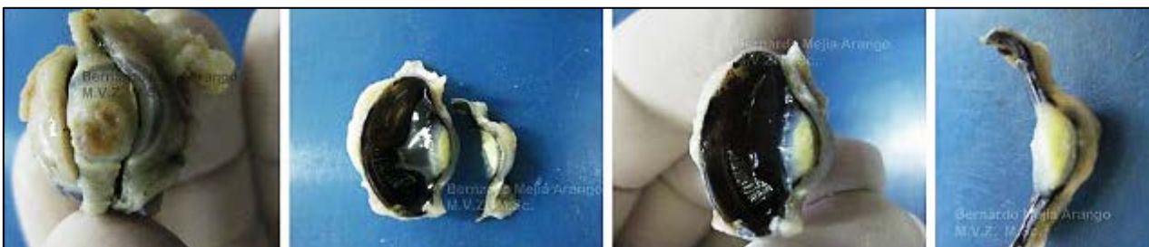
Imagen N° 6 Queratitis y micosis oculares. Proceso infeccioso del globo ocular (Panoftalmía) con lesiones corneales y de la cámara anterior. Muestra procedente de una gallina de 39 semanas de edad, de una granja con 30.368 aves de las cuales se encontraron 300 aves afectadas con secreción nasal, conjuntivitis y disnea inspiratoria. Se observaron por histopatología lesiones de laringotraqueitis viral. Dentro de las cinco aves remitidas para examen, una de las gallinas presentó la lesión ocular que se muestra en la secuencia fotográfica.

Hasta allí está claro porque los pollitos hasta los primeros 15 días de edad son receptivos a infecciones con esporas de hongos. Muchos reportes de aspergilosis ocular indican que se produce conjuntivitis severa y ulceraciones en la córnea, indicando que la infección dentro del globo ocular se origina desde una mucosa ocular lesionada; hay una publicación en la revista Avian Diseases (38:660-665) de 1994 en la cual B.J. Beckman y cinco autores más presentan un caso de queratitis por Aspergillus fumigatus con invasión intraocular en pollos de 15 días de edad.