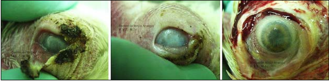
Imagen N° 4 Queratitis y micosis oculares. Gallinas de 23 semanas de edad. Lesiones inflamatorias y opacidad de la córnea. Las fotografías corresponden a gallinas del mismo lote de aves de la imagen anterior (N° 3). Las aves de las cuales se tomaron las fotografías, provienen de una granja con 70.000 aves, 13.000 de ellas con lesiones nodulares palpebrales.

En general y de acuerdo con nuestra experiencia, los casos de micosis en aves generalmente son producidas por infecciones con Aspegillus fumigatus , le sigue en proporción la infección con Aspergillus flavus y en muy raras ocasiones las infecciones son causadas por Aspergillus nidulans .