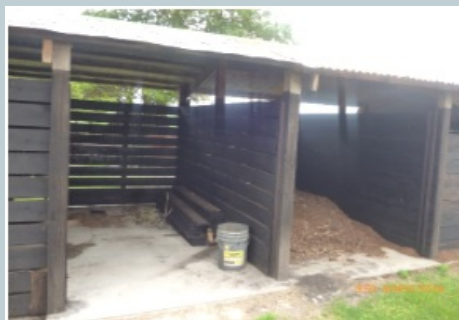
Foto 3: modelo donde se observan dos de cuatro cajones adyacentes