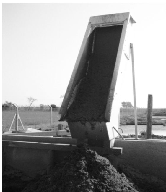
Imagen 1 . Tamiz estático instalado en la EEA Rafaela

Mediante el bombeo desde una cámara de almacenamiento temporario, el efluente crudo ingresa al tamiz a través de una tubería embridada ubicada en la parte trasera del equipo. El efluente fluye hacia el cajón de alimentación, en donde el nivel de líquido va aumentando, hasta llegar a desbordarlo, cayendo en forma de lámina de agua homogénea que se desliza por gravedad a través de toda la superficie del tamiz, en donde, por la forma geométrica de la malla filtrante se produce la separación líquido-sólido. El líquido filtrado pasa a través de las ranuras depositándose en el cajón de salida el cual es direccionado hacia las lagunas de estabilización en serie. Los sólidos que se van acumulando sobre la malla, van deslizándose a medida que sigue fluyendo efluente crudo, hasta caer sobre el playón de sólidos, en el cual se acumulan y almacenan por un tiempo determinado antes de su utilización. Existen varias aberturas de ranura de malla, en este caso se utiliza un tamaño de abertura de 1,25 mm. En el Cuadro 2 puede verse la eficiencia del tamiz, a través de la evaluación de algunos parámetros indicativos de su funcionamiento. La eficiencia de remoción se calcula como la diferencia porcentual entre el valor a la entrada y a la salida del tamiz (García et al., 2011).