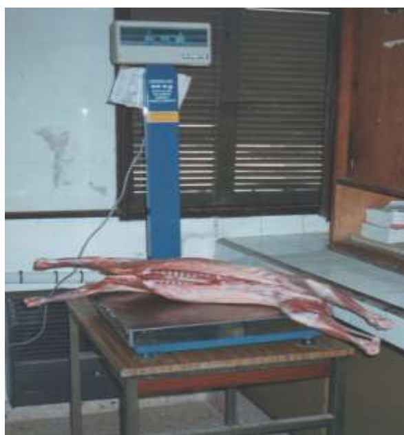
Figura .- Canal y hemicanal del cabritos Criollo