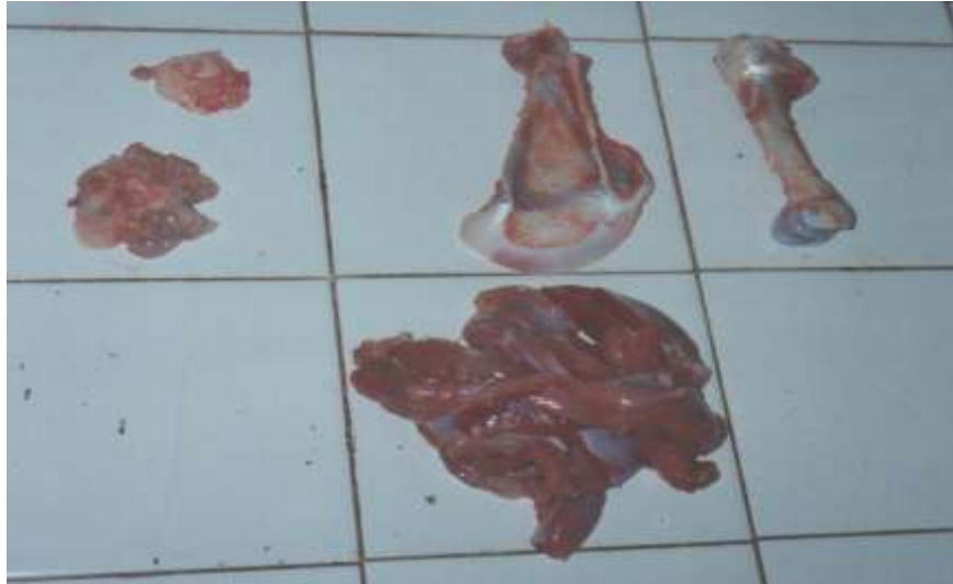
Figura .- Disección de la Espalda de cabritos Criollos