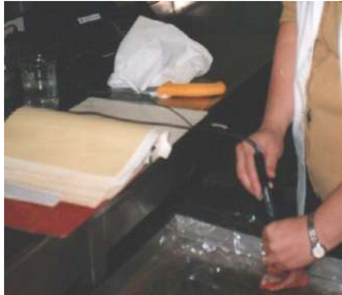
Figura .- Medición de pH en Longissimus dorsi de cabritos Criollos