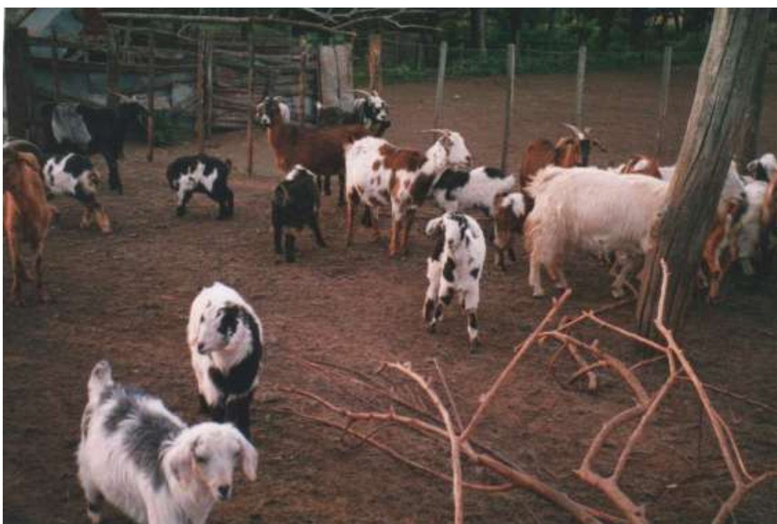
Figura .- Caprino Criollo Argentino del Suroeste de la Provincia de Córdoba