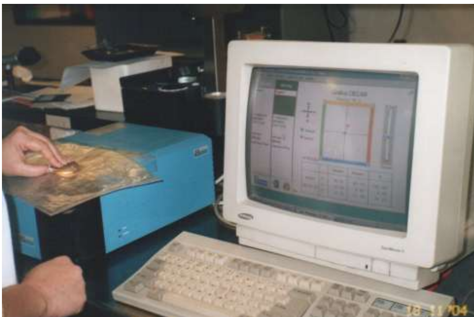
Figura .- Medición de color del Longissimus dorsi de cabritos Criollos