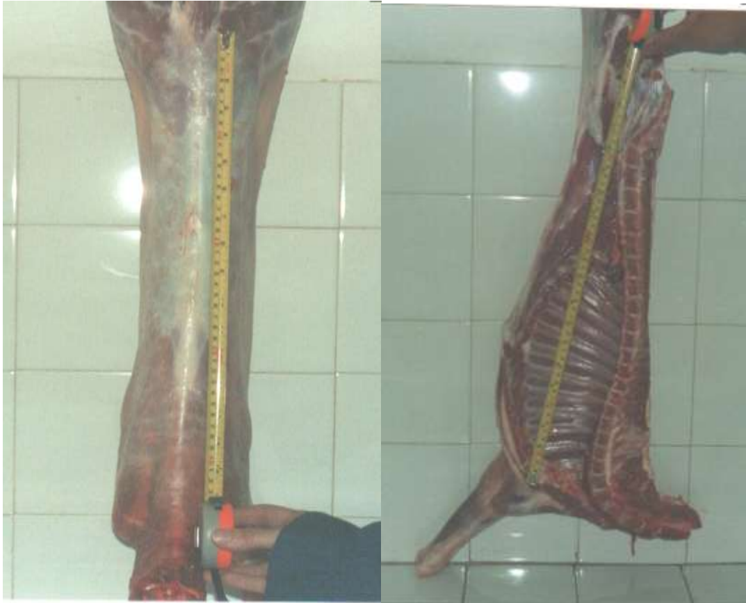
Figura .- Toma de medidas en la canal de cabritos Criollos