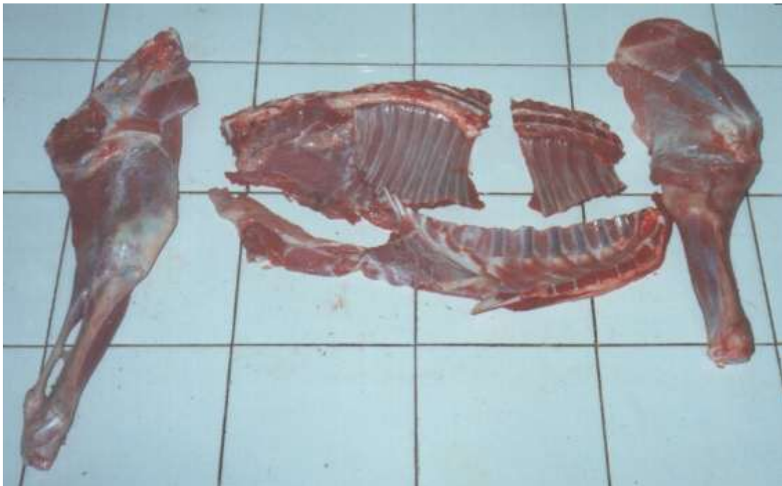
Figura .- Despiece de la hemicanal izquierda de cabritos Criollos