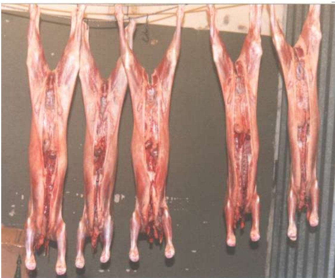
Figura .- Canales de cabritos Criollos