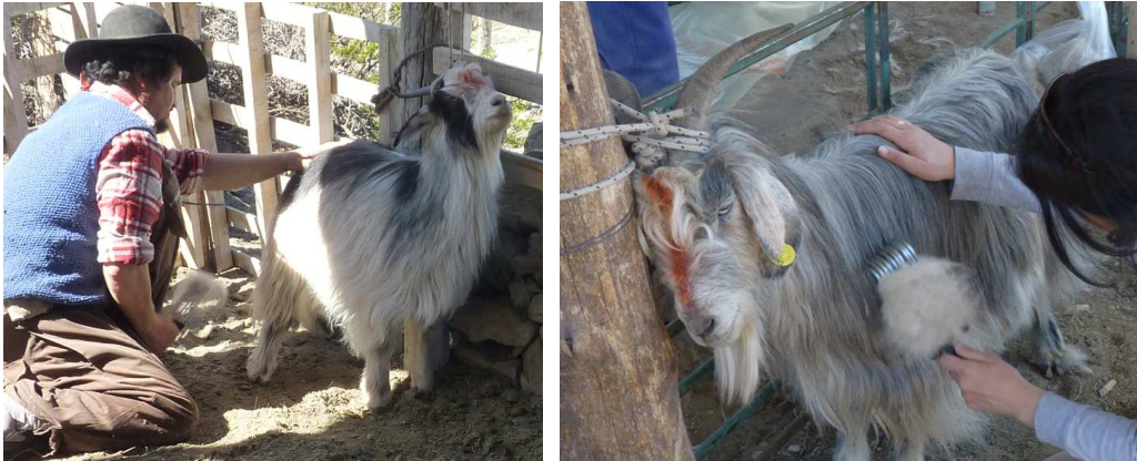
Figuras 3 y 4. Sujeción y peinado.