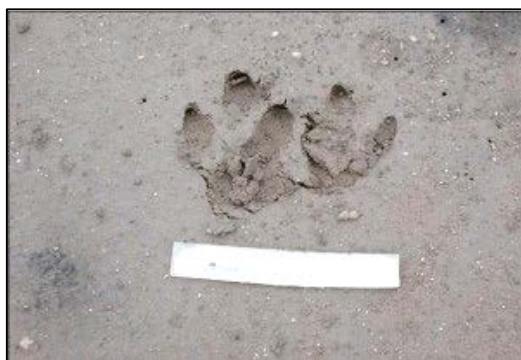
Rastros en laguna La Turca, partido de Dorrego.