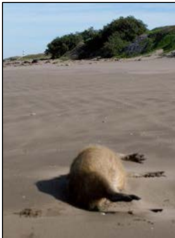
Ejemplar hembra muerto a orillas del mar a escasos metros del faro de Claromecó

Los datos aquí reportados se ubican en la llamada zona con “limitaciones marcadas para su supervivencia”. Exceptuando los registros del Arroyo Chasicó y el de la Laguna de Moreno, donde se observaron ejemplares solitarios y aislados, los restantes individuos fueron observados en grupos o familias.