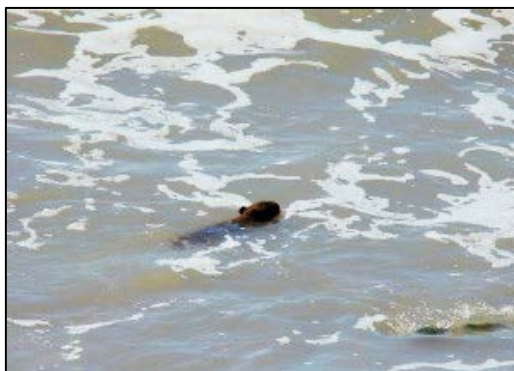
Ejemplar que se exhibe y desenvuelve en el mar, cerca de la costa (Necochea).