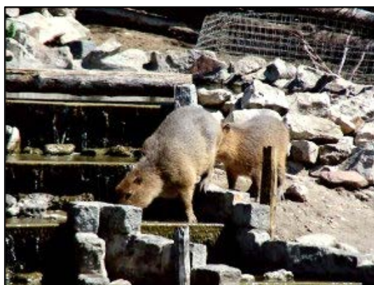
Carpinchos en "El Lago de los Cisnes" (Necochea).

A efectos de confirmar su presencia en partidos del sudeste y sudoeste bonaerense, damos a conocer una serie de registros novedosos en base a observaciones directas, rastros y/o registros fotográficos de H. hydrochaeris .