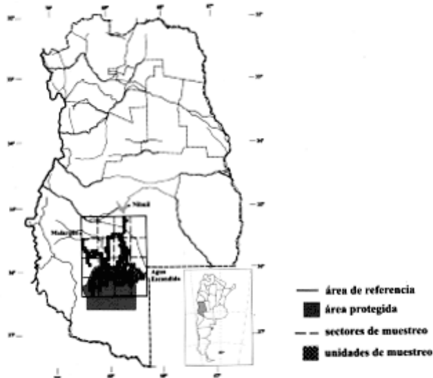
Figura 1. Localización del área de referencia, sectores y unidades de muestreo y de la Reserva La Payunia. Figure 1. Location of the reference area, sectors, sampling units, and La Payunia protected area.