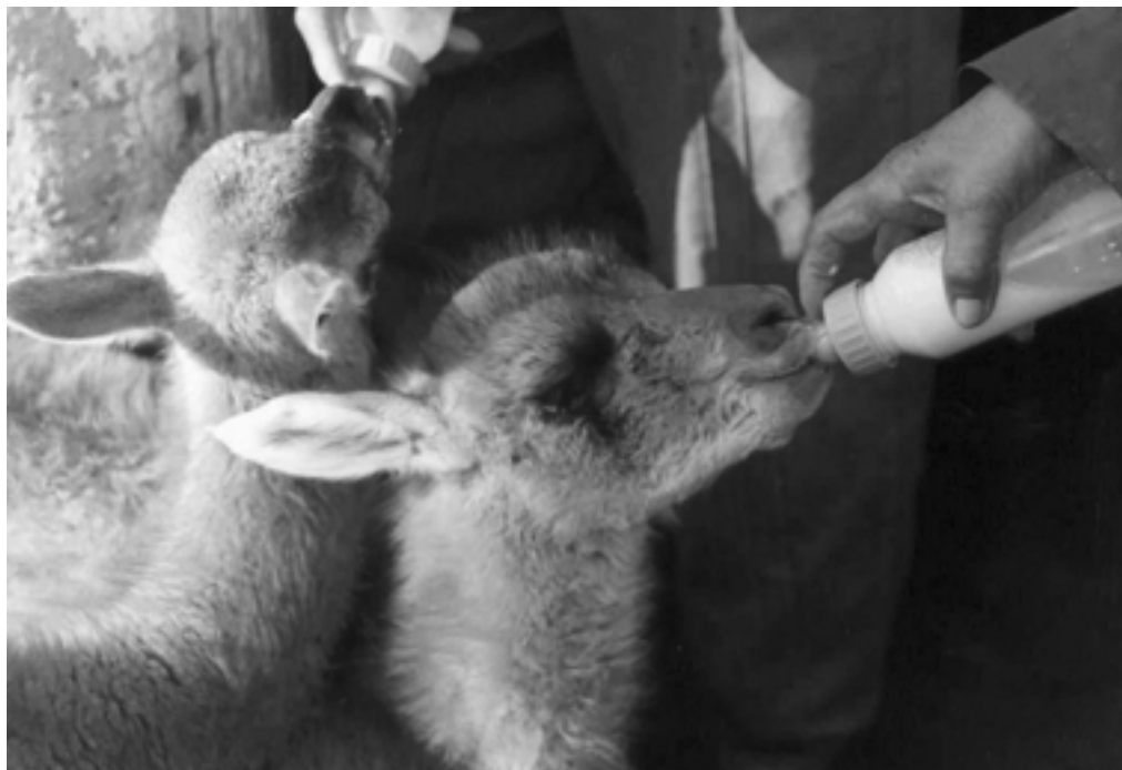
● Desarrollo de la crianza en semicautividad. Los chulengos deben criarse a mamadera durante 100 a 120 días.

Identificaciones. Los animales deben estar claramente identificados para cumplimentar cualquier demanda de control que determine la autoridad de aplicación. Se