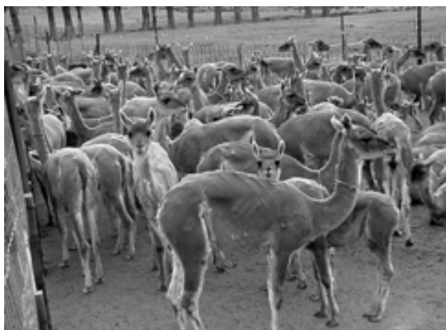
● La esquila en la Patagonia se debe realizar en octubre.

Las categorías son: chulengo hasta 6 meses, juvenil de 6 a 18 meses, subadulto de 18 a 36 meses y adulto mayor de 36 meses.