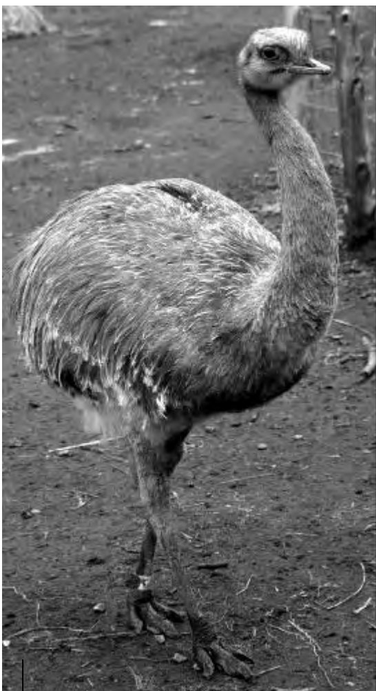
■ "Ñandú patagónico o choique"

badora es recomendable lavar los huevos si se presentan sucios (bosta, sangre, barro) con agua a 40-42 °C y un desinfectante; marcarlos con un número sobre su cáscara; y pesarlos para conocer su peso inicial y así controlar la pérdida de peso durante la incubación (entre el 12-15% de su peso inicial).