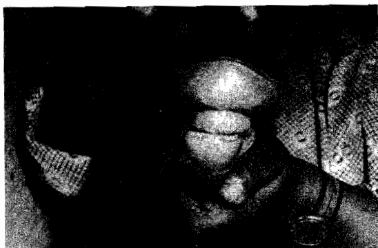
FIG. 1: Potrillo de 1 semana de edad, incisivos centrales inferiores erupcionados.

A esta edad, un cierto número de casos presentan