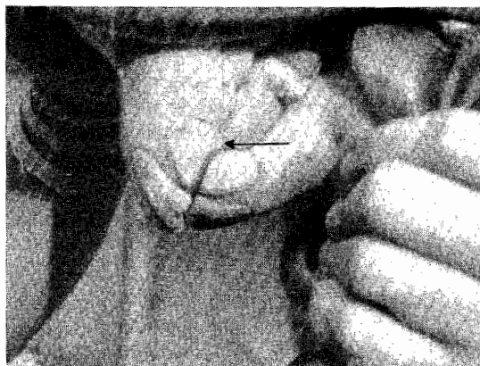
FIG. 4: Equino de 7,5 años, en el incisivo extremo superior se observa la primera Cola de Golondrina.

12 a 13 años: Los incisivos centrales inferiores comienzan a tomar la forma