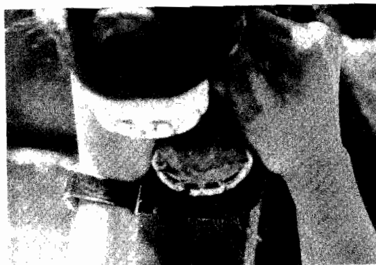
FIG. 3: Equino de dos años, se encuentran rasados los incisivos centrales e intermedios inferiores. La flecha indica la estrella dentaria de forma alargada en los incisivos centrales inferiores.

nivelados los incisivos centrales inferiores y en raras ocasiones esta característica también se presenta en los incisivos centrales superiores.