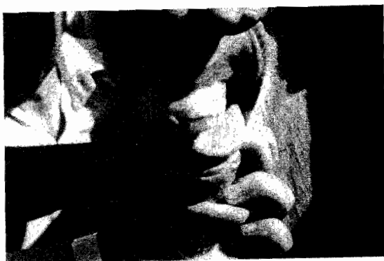
FIG. 2: Potrillo de 30 días de edad, incisivos intermedios inferiores erupcionados.