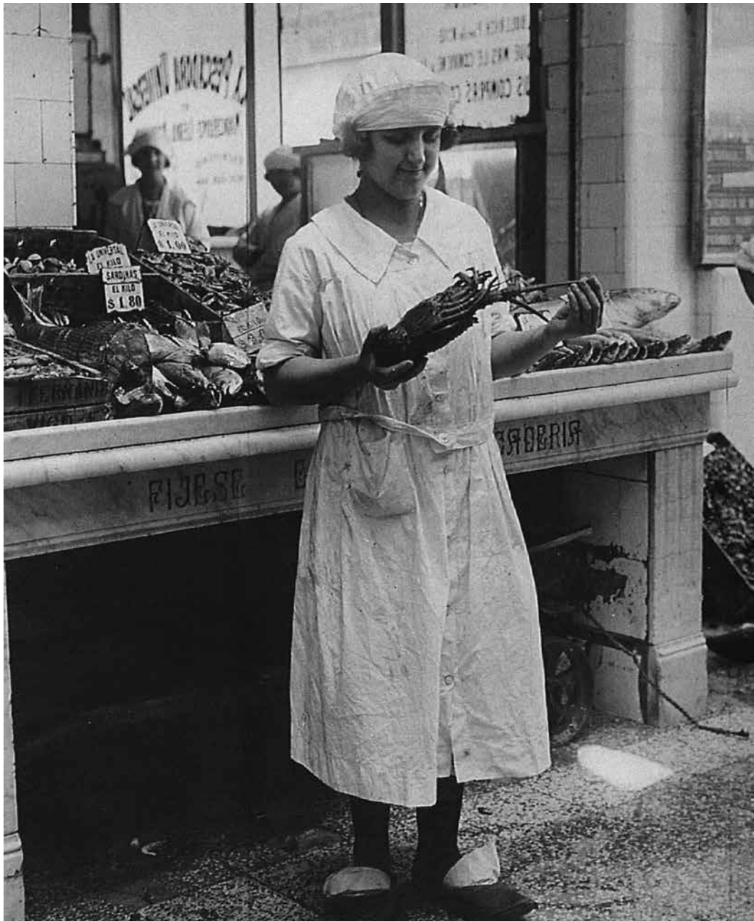
Figura 1: Puesto de pescado en un mercado de Buenos Aires (c.1924)

que serían más provechosos de coleccionar y diseccionar que comer. Durante las primeras horas de la mañana, en lugares como el Mercado del Centro, sería factible observar una pequeña muestra del mundo marino recolectada por los pescadores el día anterior. Así, el ritmo del mercado fue integrado en los patrones de las actividades de los naturalistas: las visitas matutinas a estos sitios y en las diferentes estaciones del año permitían deducir la abundancia, la estacionalidad o la aparición temporaria de ciertas especies cerca de la costa.