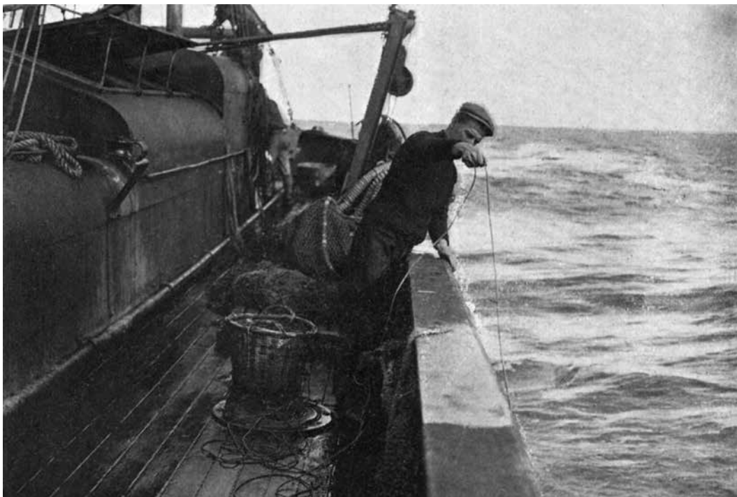
Figura 3: Medición de la profundidad antes del lance de la red (Zabala, 1910)

Al empezar sus campañas, la primera empresa pescadora encontró en abundancia peces que hasta la fecha no habían sido hallados por vivir sin duda en fondos a donde no podían alcanzarlos las pequeñas redes usadas hasta entonces por los pocos pescadores de Mar del Plata. Los peces de que hablo llamaron mucho la atención del público por su clase de coloración de un rojo subido y su cabeza armada de espinas; y como el público no compra en general sino los pescados que conoce o de los cuales ha oído hablar, la empresa pesquera bautizó a éstos con el nombre de rouget, aunque los verdaderos