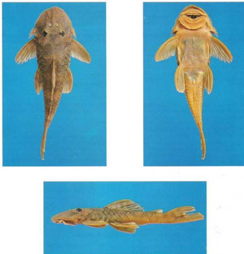
Fig. 1. - Lithoxancistrus orinoco n. gen., n. sp., holotype de vues dorsale, ventrale et latérale. Lithoxancistrus orinoco n. gen., n. sp., holotype in dorsal, ventral and lateral view.

par Isaac J.H. ISBRÜCKER *, H. NIJSSEN * et Plutarco CALA **