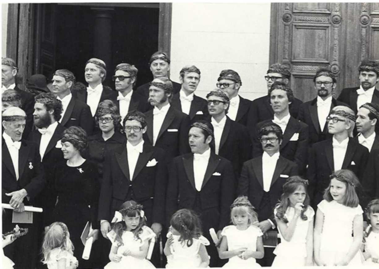
Foto grado colectivo, luego de la imposición de la corona de laureles y recibir el diploma acreditando el grado de Doctor (Ph. D.), Universidad de Lund, Suecia, año 1975