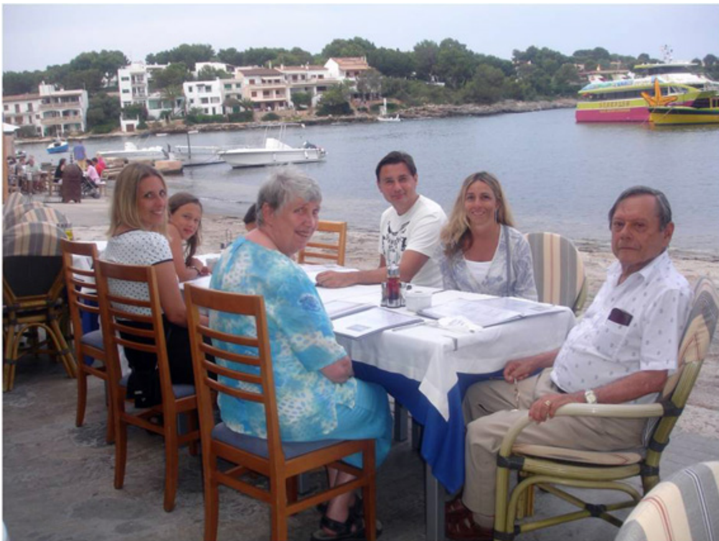
Familia de Vacaciones en Mallorca, España