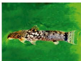
5 Astroblepus chotae Siluriformes - Astroblepidae "Bagre"