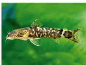
6 Astroblepus cyclopis Siluriformes - Astroblepidae "Bagre"