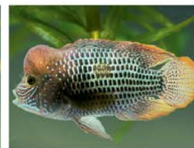
4 Andinocara rivulatus (macho) Perciformes - Cichlidae "Vieja azul"