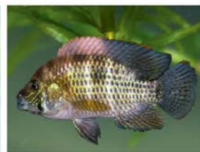
3 Andinocara rivulatus (hembra) Perciformes - Cichlidae "Vieja azul"