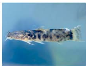
7 Astroblepus grixalvii Siluriformes - Astroblepidae "Bagre"