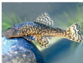
2 Ancistrus clementinae Siluriformes - Loricariidae "Raspabalsa"