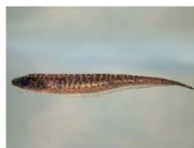
8 Brachyhypopomus occidentalis Gymnotiformes - Hypopomidae "Bio-bio"