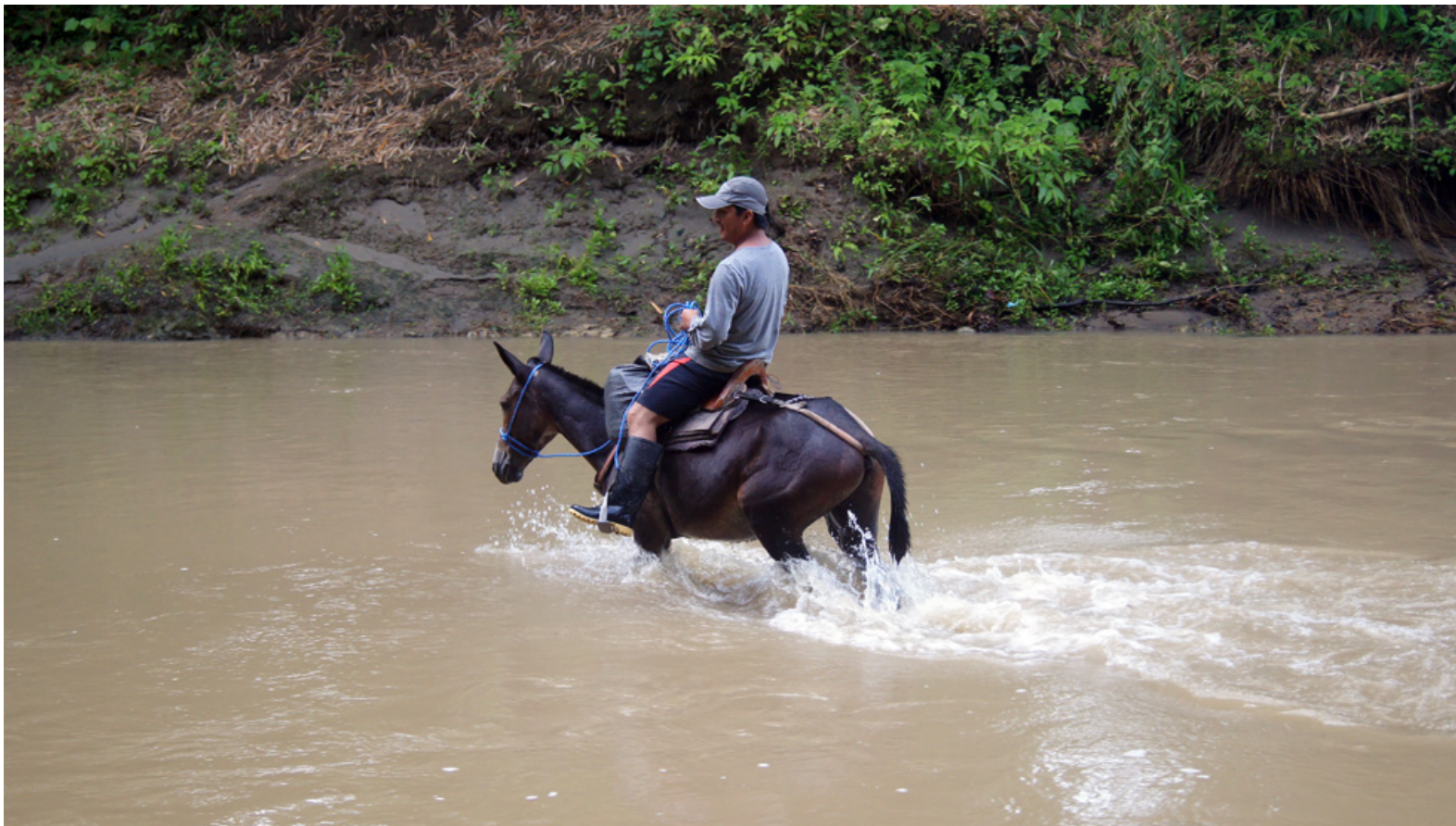
Cruzando el río Brito en época lluviosa para el muestreo de peces, Río Verde, Esmeraldas, Ecuador, mayo de 2015