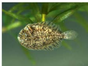
1 Achirus scutum Pleuronectiformes - Achiridae "Lenguado"

La provincia de Los Ríos está ubicada en la región costa o litoral del Ecuador. Presenta un clima tropical con temperaturas que oscilan entre los 22 a 33 °C. Debido a que su relieve es plano ha favorecido mucho a las actividades agrícolas y la construcción de infraestructura de riego y control de inundaciones; lo que también ha propiciado una gran destrucción de sus ecosistemas naturales terrestres y acuáticos. Sin embargo, aun presenta una gran variedad de flora y fauna principalmente asociada a los ecosistemas acuáticos. Presenta un sistema hidrográfico muy denso considerando el tamaño de la provincia. Los principales ríos que conforman este sistema son: Babahoyo, Caracol, Catarama, Ventanas, Macul, Zapotal, Vines, Quevedo, y varios humedales denominados Abras de Mantequilla. Presenta un recorrido de norte a sur y se une al gran río Guayas antes de desembocar en el Océano Pacífico. Dado el desconocimiento de la ictiofauna, existe un gran interés científico sobre este grupo de fauna de aguas interiores del Ecuador y ha sido motivo de estudio de naturalistas e investigadores durante los últimos años. Sin embargo se ha prestado poco interés sobre las potencialidades de este recurso. Este trabajo se realizó principalmente dentro del marco de estudios ambientales propiciados por los proyectos de riego y control de inundaciones de la provincia de Los Ríos.