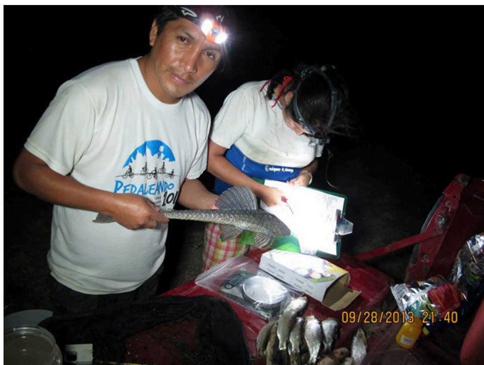
Monitoreando de noche peces en el río Daule, provincia del Guayas, Ecuador, septiembre de 2013 (ambas fotografías)