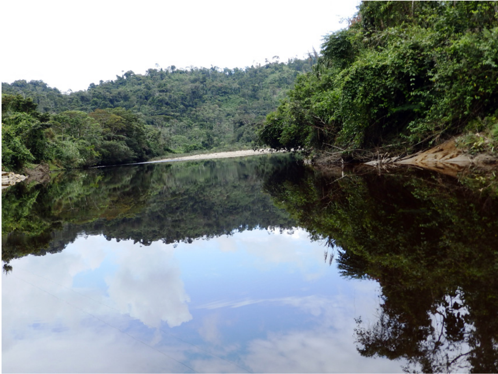
Foto del río Numpatakayme sobre los 1000 msnm navegable, junio de 2015 Nace en el límite de Ecuador y Perú, recorre de sur a norte y desemboca en el Océano Atlántico