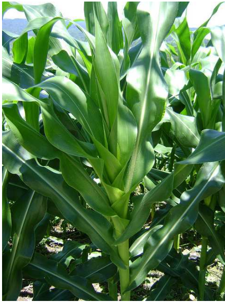
Verdeo de maíz