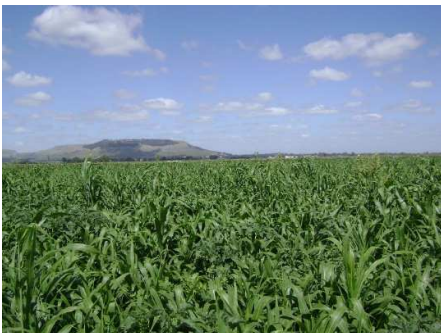
Verdeo de sorgo (1)