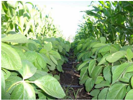
Verdeo soja (1)