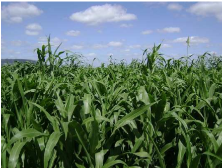
Verdeo de sorgo

La mayor producción en soja se alcanza con pastoreos frecuentes (45 cm de altura) y de baja intensidad, de manera de no perjudicar el posterior rebrote. La densidad de siembra debe ser 20% más alta que la utilizada para cosecha de grano, ya que el pastoreo implica pérdida de plantas. En la zona se utiliza para esta finalidad entre 400 y 450.000 plantas/ha a la siembra. Si bien algunos estudios encuentran mayor diferencia de aptitud forrajera entre variedades que entre grupos de madurez, según los antecedentes nacionales los cultivares de ciclo largo (VI a VIII) y en lo posible indeterminados, serían los más aptos para el uso forrajero. Utilizando materiales de ciclo largo se busca que la planta se desarrolle produciendo biomasa verde (hojas, tallos, ramas) y no grano. Por último, una vez pastoreada, no es recomendable desmalezar, ya que el rebrote se produce de las yemas ubicadas en el tallo, a diferencia de lo que ocurre en sorgo, donde la desmalezada post-pastoreo es una práctica recomendada con el fin de homogeneizar el rebrote.