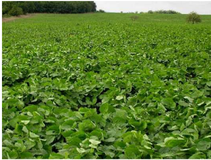
Verdeo de soja