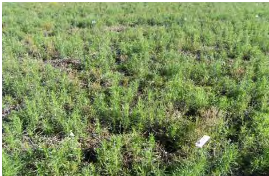
Foto 2. Cobertura de C. bonariensis al momento de realizar los tratamientos

En la foto 2 se puede observar el tamaño y cobertura de Conyza bonariensis en el lote tratado.