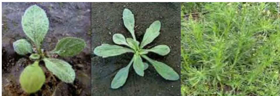
Foto 1. Conyza bonariensis en estado vegetativo y reproductivo.

Conyza bonariensis (foto 1), es una especie ciclo anual, inicia su germinación en el otoño temprano, vegeta durante el invierno y primavera y florece desde fines de primavera hasta mediados del verano.