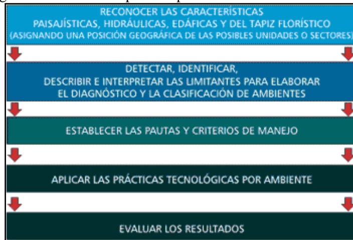
Diagrama 3: Secuencia operativa para definir las actividades a seguir

Asumido el enfoque, conocidos los ejes de acción y establecido la articulación de tareas, se impone un relevamiento de las limitantes edáficas a la productividad de la situación, con el fin de disponer de elementos para identificar diferentes ambientes y con ello distintas estrategias de manejo.