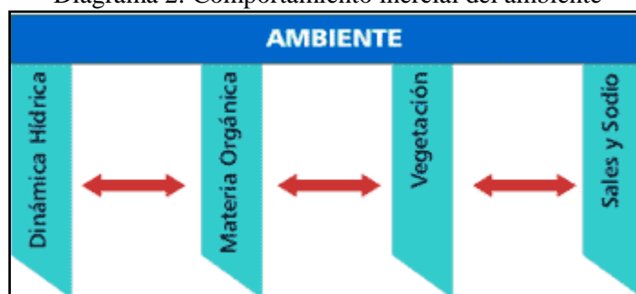
Diagrama 2: Comportamiento inercial del ambiente

Respecto a los soporte del ambiente, sin duda la relación temporoespacial de los siguientes cuatro ejes determina su comportamiento inercial, ellos son: dinámica hídrica, materia orgánica edáfica, vegetación y la concentración de sales y sodio en el suelo (Diagrama 2).