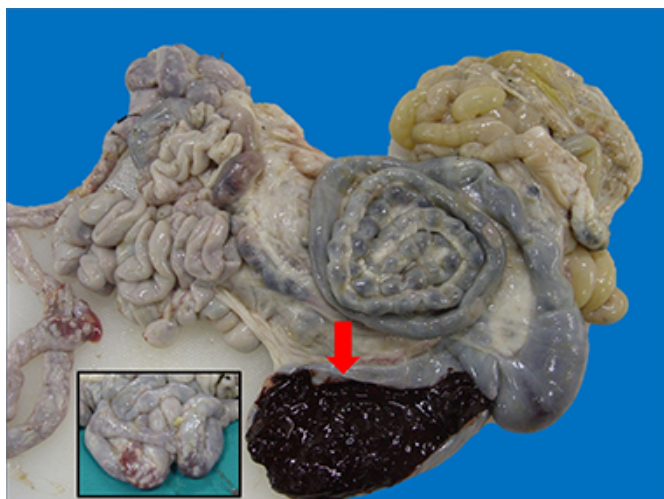
Figura 3. Intestino delgado y grueso. Obsérvese el color oscuro y la consistencia pastosa del contenido cecal (flecha). Los nódulos blanquecinos y la hemorragia en íleon se aprecian desde la serosa (recuadro).

de 13,9 \times 10^5 ooquistes. En el cultivo del contenido cecal, se evidenciaron dos clases de ooquistes: 1) elipsoidales de 32 \times 22 \mu\text{m} de tamaño, con cápsula polar, micrópilo y color de la pared marrón-amarillento clasificados como Eimeria arloingi en un 90% del conteo; 2) subesféricos de 24 \times 20 \mu\text{m} de tamaño, sin cápsula polar, con micrópilo y color de la pared marrón-verdoso identificados como Eimeria ninakohlyakimovae en un 10% del conteo.