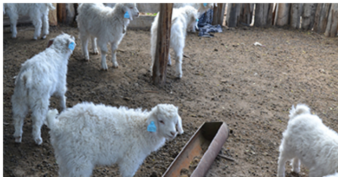
Figura 1. Cabritos en el cobertizo donde ocurrió el brote. Obsérvese la escasa dimensión, la falta de limpieza y la ausencia de signos de diarrea en el suelo y en los cabritos.

En el momento de la inspección se observó un cabrito en estado agónico que estaba en decúbito lateral, con extrema debilidad, espuma en la boca, extremos de los miembros hipotérmicos y marcada palidez de las mucosas. En la revisión clínica tanto las madres como el resto de los cabritos se encontraban alertas y vigorosos, sin signos de diarrea, anorexia o debilidad (Figura 1).