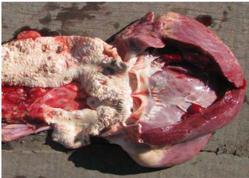
Figura 1. Imagen macroscópica en donde se observa severa calcificación de la pared de la aorta y del endocardio.

Se evidenció en las paredes de los grandes vasos la presencia de fibras elásticas tumefactas y fragmentadas (Fig. 2) con acumulaciones y depósitos granulares basófilos entre las mismas. En los sitios en donde las lesiones eran más severas se observaron células fibroblásticas que en algunos casos evidenciaron cambios metaplásicos. En pulmón se detectaron áreas de enfisema con depósito mineral en los espacios inter-alveolares y exudación mononuclear leve. En los demás órganos evaluados no se observaron lesiones histológicas. A la coloración de von-Kossa (Fig. 3) se confirmó la presencia de sales de calcio en los tejidos que presentaban los focos y placas de mineralización.