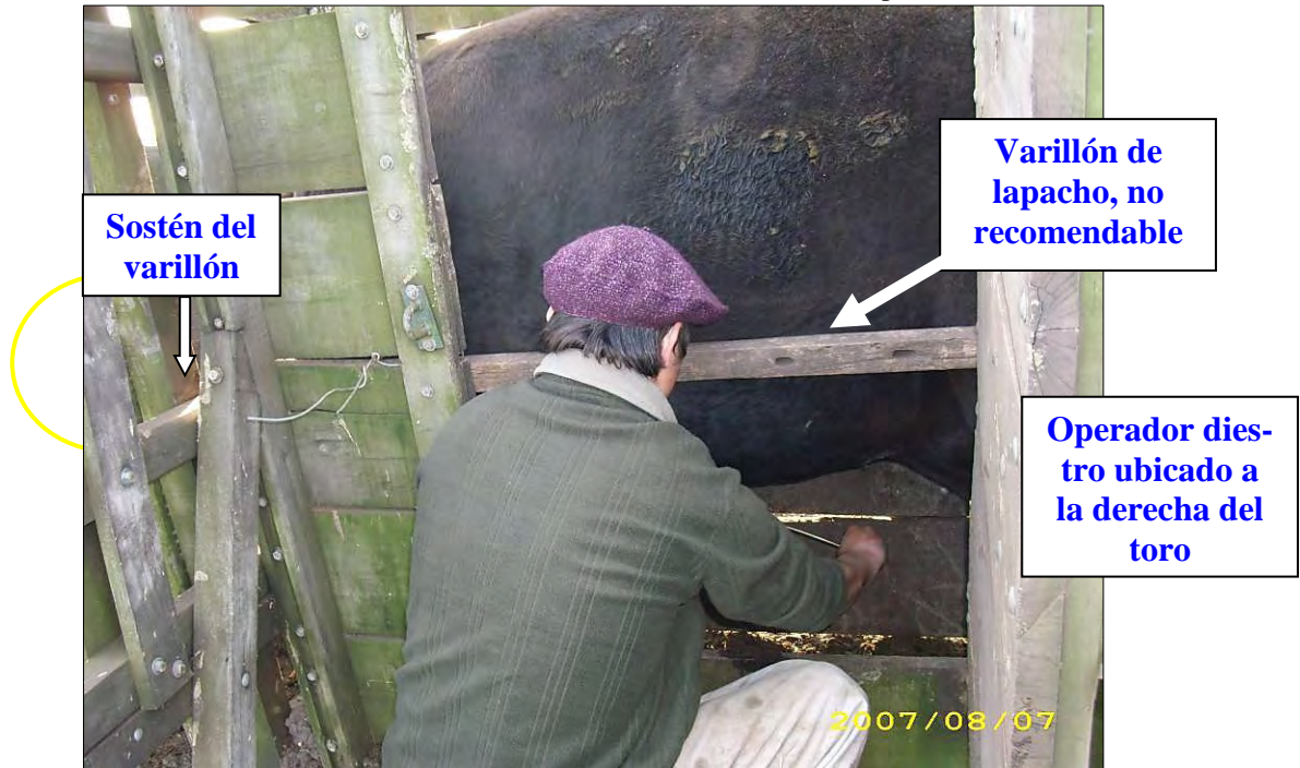
Foto 2.- Varillón sostenido con marra de alambre simple.

Importante: no debe ser material débil ni “astillable” pues los movimientos bruscos del Toro, que los hay, pueden lastimar a quien se encuentra haciendo el raspaje.