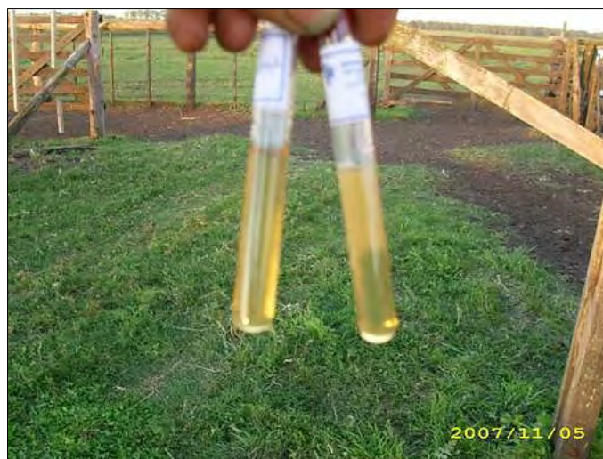
Foto 5.- Se observa cómo queda la muestra en medio semisólido (derecha).

La ventaja que advertimos en este método, es que el tropismo negativo de la tricomonas respecto al oxígeno, hace que estas se desplacen hacia el fondo del tubo, donde crecen sin competencia de hongos o bacterias, los cuales quedan con el esmegma, pelos, tierra, suspendidos en la parte superior.