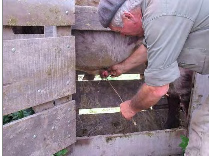
Foto 3.- A la altura de la cabeza del operador se ve la tabla que limita el movimiento al toro. La piel del borde prepucial se toma con la palma hacia el toro y el pulgar hacia abajo; la buena presentación hace innecesario cortar los pelos del prepucio, y permite detectar con claridad las llagas cuando las hay. En la foto ya se ha girado la mano, tras la introducción del raspador; luego se correrá a la zona del glande, para guiar el raspaje.