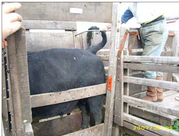
Foto 1.- Para la torsión de la cola puede apoyarse la mano izquierda en su base.

1.- El toro pateo, sacando hacia fuera la articulación de la babilla; al sentirla trabada por la tabla, cambia – aparentemente- su proceso cerebral. Y pateo hacia atrás, o eventualmente hacia delante, de forma suave por limitación de movimiento (Foto 1). La ventaja real es que el operador trabaja con total tranquilidad. Para el toro, al trabajarse suelto en la casilla de operar, a lo sumo con una leve presión del “apretavacío”, se disminuye la incomodidad, el estrés y consecuentemente la reacción.