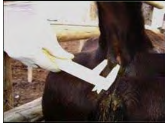
Foto 2: Técnica de intradermorreacción en el pliegue anocaudal interno.