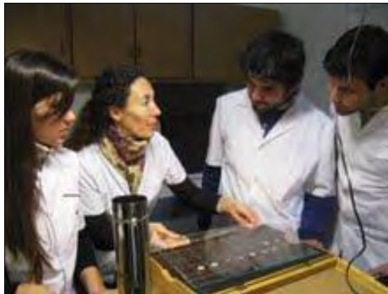
Foto 1: Alumnos y docentes realizando la técnica de BPA para el diagnóstico de Brucelosis.

Para brucelosis se analizaron vacas y vaquillonas mayores de 18 meses y machos enteros mayores de 6 meses. Se utilizó la técnica del Antígeno bufferado en placa (BPA) como tamiz y a los sueros positivos se les realizó las pruebas complementarias de Seroaglutinación en tubo (SAT) y 2-Mercaptoetanol (2-ME) (foto 1).