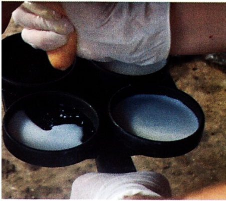
Con la mejora en "Calidad de Leche" el ingreso por leche aumenta entre un 3 y 4%.

nidos de las Bonificaciones por Células Somáticas, debemos destacar también la merma en los Costos disminuyendo la cantidad de tratamientos mensuales de Cuartos Clínicos. El Cuadro N° 3 muestra dos ejemplos.