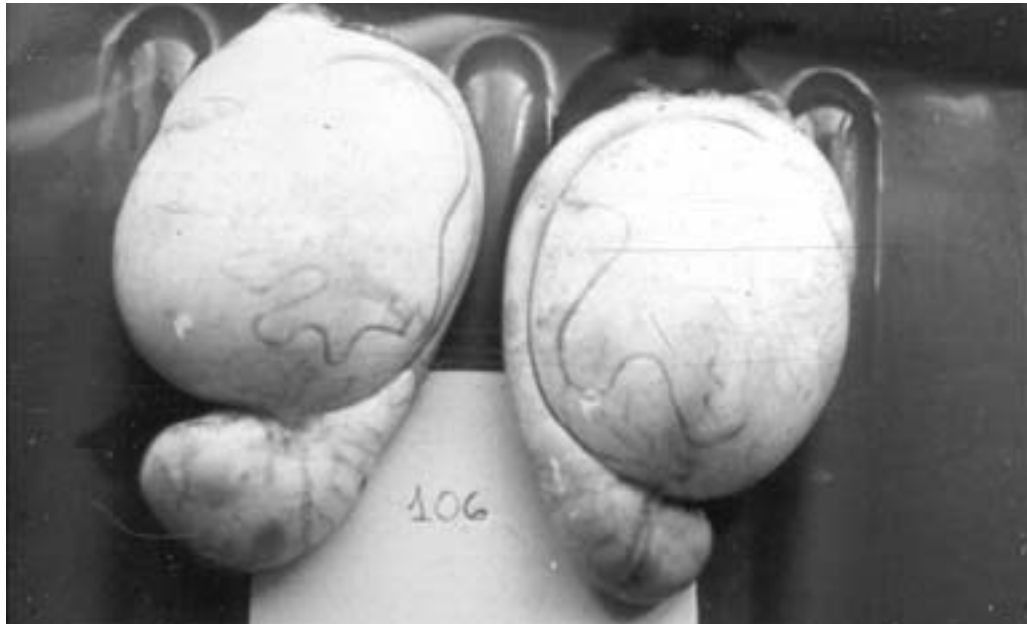
● Órganos lesionados de un carnero infectado naturalmente con Brucella ovis . Nótese la hipertrofia de la cola del epidídimo izquierdo, como así también el cuerpo y cabeza del epidídimo derecho.

dio, que variaron entre un 0% y 52% de carneros positivos, y con una prevalencia media estimada del 8.2% para la región.