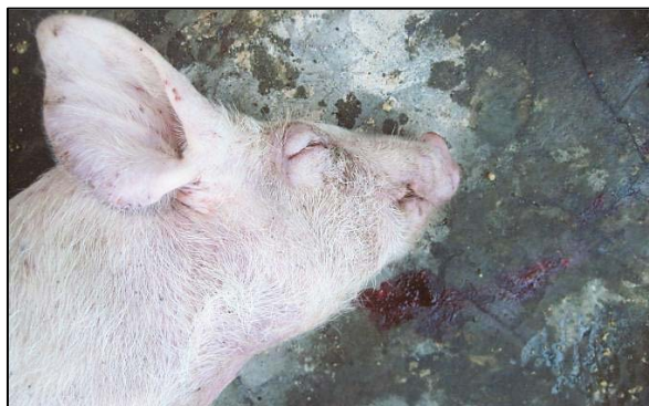
Figura 5. Cerdo en transición, en posición decúbito y edema de los párpados, típica de la enfermedad de los edemas.

Los principales signos clínicos en los grupos afectados son apatía, ataxia descoordinada, estupor, postración, balanceo y locomoción torpe. Estos cerdos responden al manejo con chillidos agudos anormales. La hinchazón gelatinosa y suave de la piel de los párpados superior e inferior es un rasgo prominente en muchos cerdos enfermos (figura 5). Los lechones afectados parecen “cachorros chillones borrachos”. En cada lote de cerdos la enfermedad dura durante aproximadamente dos semanas. Puede haber un aumento moderado de los niveles de mortalidad durante el periodo de transición, por ejemplo de 3 a 4 %, hasta un 5 a 6 %. En la necropsia de algunos cerdos afectados el edema es evidente en los párpados, pero también en el área del mesocolon del colon espiral (figura 2) y en la pared del estómago. El saco pericárdico de algunos cerdos puede presentar un exceso de contenido líquido.