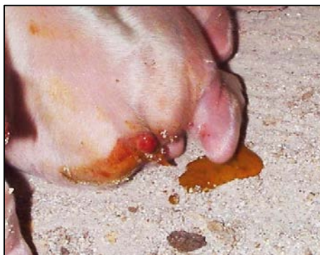
Figura 1. Lechones enfermos con diarrea acuosa en la zona de parto.

Clínicamente se observa que todos los lechones jóvenes en varias camadas tienen periodos de diarreas explosivas de color blanco o amarillo-naranja. Parece ser que el problema se extiende alrededor de las zonas de parto y lactancia. Una inspección minuciosa indica que los lechones afectados son en general muy jóvenes, de 1 a 7 días de edad. Presentan diarrea acuosa, que se expulsa como un chorro por el ano. Los lechones están deprimidos, se acurrucan juntos y no se mueven (figura 1).