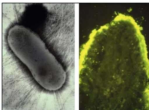
Figuras 2 y 3. Microfotografía de E. coli enterotoxigénica con numerosos fimbrias-pili (2, izquierda). Microfotografía de intestino de cerdo con amplias colonias de E. coli enterotoxigénica unidos a la vellosidad (3).

Como la colibacilosis neonatal, esta enfermedad se debe a cepas de E. coli enterotoxigénicas (ETEC) que poseen una combinación de factores de fijación y enterotoxinas, que son ambos necesarios para que se produzca la enfermedad intestinal completa. Sin embargo, esta forma de diarrea por E. coli se produce en los cerdos que ya han sido destetados de sus madres. Los factores de unión de las cepas ETEC son proteínas fimbriales o pilis especializados, que se adhieren firmemente a los receptores de la glicoproteína de los enterocitos en las células intestinales. La figura 2 ilustra estas fimbrias. Estos receptores sólo están presentes durante un tiempo limitado, normalmente en los cerdos hasta seis semanas después del nacimiento. Estos factores de fijación se conocen actualmente como antígenos fimbriales F4, F5, F6, F41, etc., aunque todavía son muy conocidos por sus denominaciones anteriores: K88, K99, 987P, etc. Esta unión y adherencia permite que la ETEC resista los movimientos intestinales normales y así colonizar el intestino. La figura 3 ilustra la fijación de densas colonias de E. coli en una vellosidad intestinal. Entonces la ETEC puede producir e inyectar sus enterotoxinas, como las toxinas termolábiles o termoestables. Estas toxinas actúan sobre las células intestinales causando diarrea hipersecretora, produciendo la salida de flujo hacia el lumen intestinal, pero sin daño celular importante.