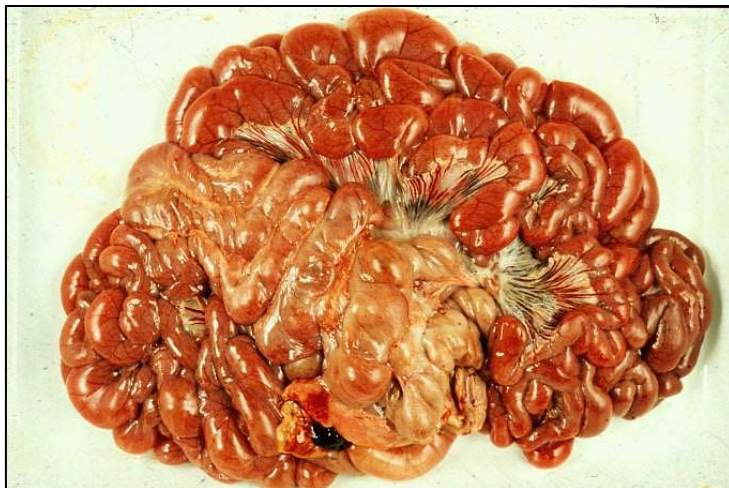
Figura 6. Necropsia de un cerdo en transición con colibacilosis posdestete. Se observan los intestinos dilatados llenos de líquido acuoso.

La necropsia debe realizarse en los cerdos que acaban de morir. La necropsia en los casos de diarrea por ETEC suele mostrar asas intestinales dilatadas, de pared fina y congestionadas, llenas de diarrea acuosa de color amarillo (figura 6), con deshidratación y reducción de la grasa corporal.