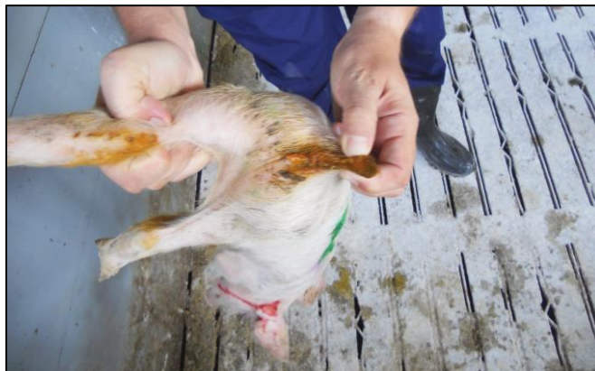
Figura 4. Lechones con diarrea acuosa de color amarillo, típicas de la colibacilosis posdestete.

Los signos clínicos de la ETEC posdestete se producen casi siempre alrededor de dos semanas posdestete, con un brote de diarrea de color amarillo-blanco, cremoso-acuoso, proyectado a chorro (figura 4). El periodo de incubación es de sólo 10 a 30 horas, por lo que rápidamente aparecerán muchos cerdos afectados en los grupos de transición. Esta diarrea acuosa presenta pequeñas evidencias de alimento sólido y los animales muestran rápidamente deshidratación y pérdida de la condición corporal. A menudo es posible presionar el abdomen de un cerdo sospechoso y ver si esta diarrea es evidente. En un mismo grupo de cerdos puede variar la consistencia de la diarrea, desde muy acuosa a pastosa con una amplia gama de color que incluye el blanco, gris, amarillo y verde. No hay presencia de sangre fresca o moco. A menudo los cerdos afectados provienen de las primerizas. En los casos más graves, los cerdos pueden encontrarse muertos, con los ojos hundidos y ligera cianosis de las extremidades.