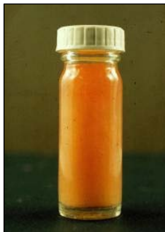
Figura 9. Muestra líquida con presencia de E. coli .

A través de la curvatura mayor se produce la distensión de la submucosa del estómago por fluido gelatinoso claro ( figura 9 ) y, a menudo, en el colon la inflamación es muy notable en el mesocolon, en la flexura espiral. La histopatología del cerebro demostrará vasculitis degenerativa y hemorragias perivasculares particularmente en el tronco cerebral. El cerebro carecerá de cambios inflamatorios, tales como los indicados en los casos del sistema nervioso causados por meningitis por Streptococcus o privación de agua.