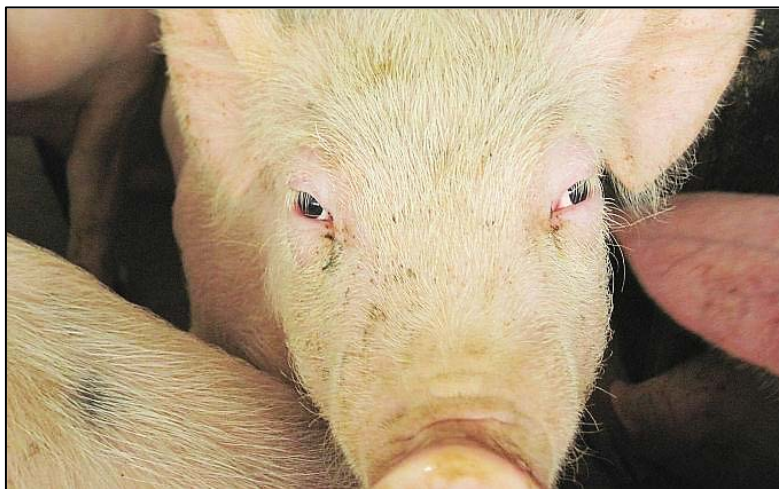
Figura 8. Cerdo con presencia de hinchazón edematosa en los párpados.