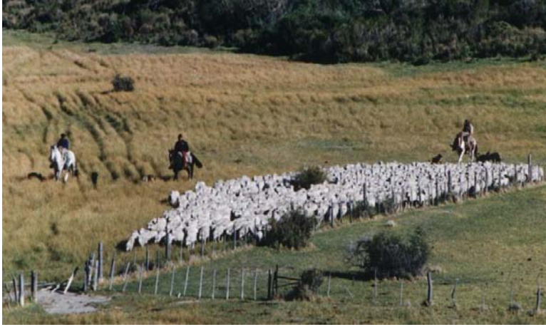
Foto 1: Imagen típica del medio rural patagónico de Argentina, en donde la cría ovina es habitual. En ella se observan los distintos componentes del ciclo doméstico de E. granulosus : perro –hospedero definitivo-, ovinos –hospederos intermediario-, humano –hospedero accidental-, y medio ambiente