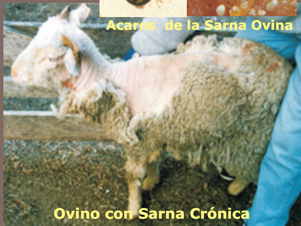
Ovino con Sarna Crónica