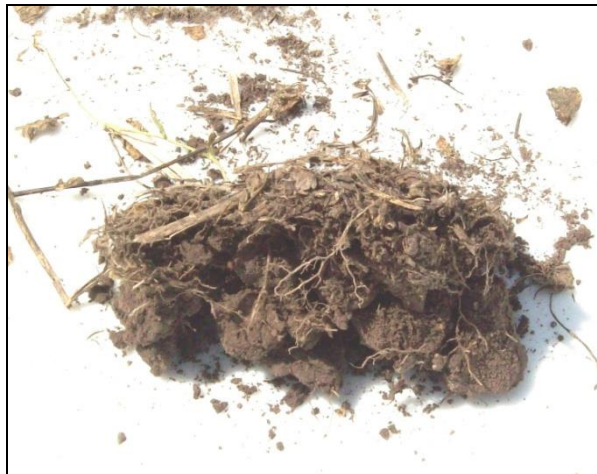
Imagen 2. Porción superficial (0-3 cm) de uno de los suelos estudiados

Pueden apreciarse restos sin descomponer (broza), raíces y agregados pequeños en superficie. En el estudio de referencia, la profundidad de esa capa tuvo como valores extremos a 3,5 y 8, con una media de 5,2 cm y una mediana de 5 cm. El espesor de la capa superficial testado en RP y EE coincide con el valor promedio de la primera capa según Cve. Ello permite suponer que la más alta EE para 0-5 cm se relaciona con una mejor condición físico-biológica que daría lugar a la formación de agregados de origen biológico, con mecanismos de cohesión cuyas fuerzas serían relativamente elevadas. Es asimismo probable que los contenidos de MO sean también superiores respecto a la capa 5-20 cm, pero en este trabajo el carbono orgánico no se discriminó por profundidades.